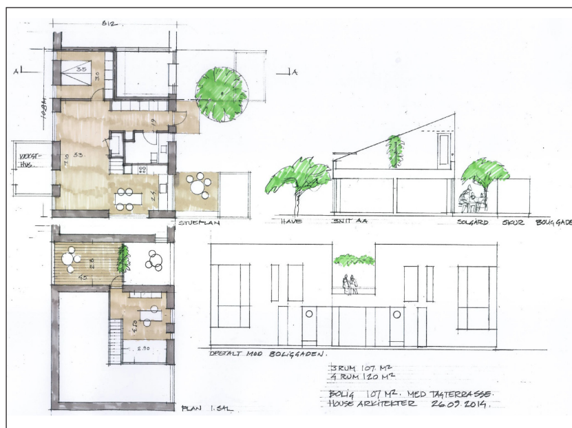
Her nogle indledende skitser til de 80 planlagte rækkehuse.